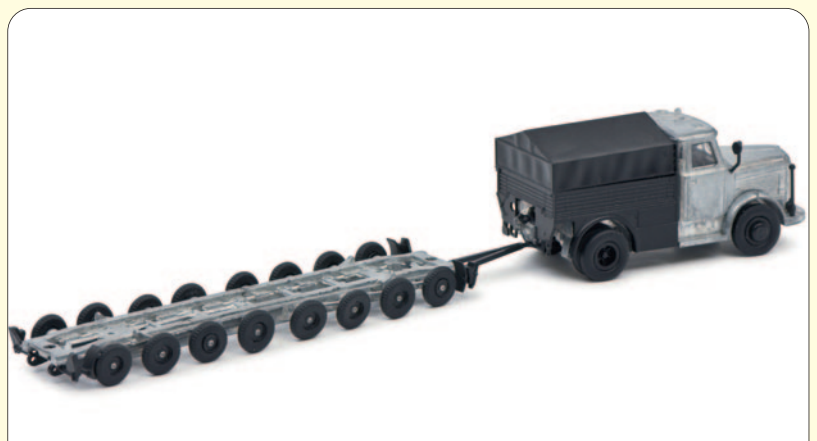
NEUES VON SCHUCO (28)