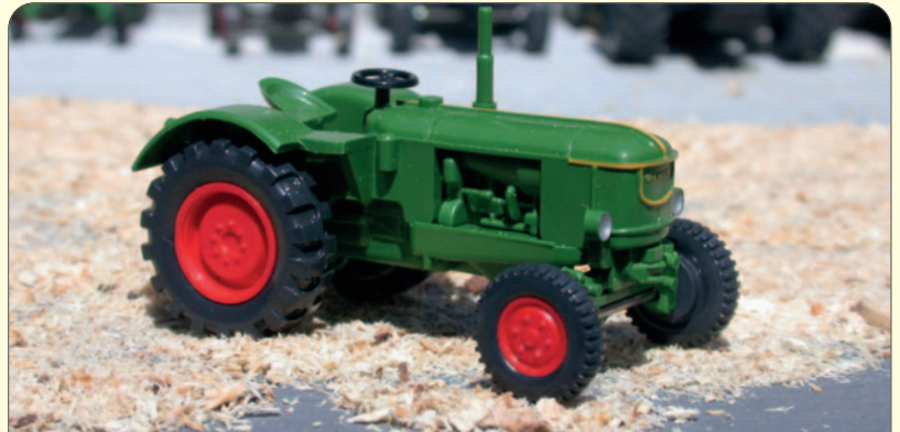
DEUTZ-TRAKTOREN VORBILD UND MODELL (14 - 17)