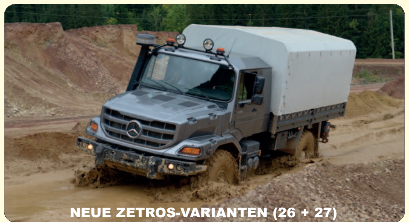
NEUE ZETROS-VARIANTEN (26 + 27)