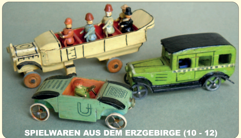
SPIELWAREN AUS DEM ERZGEBIRGE (10 - 12)