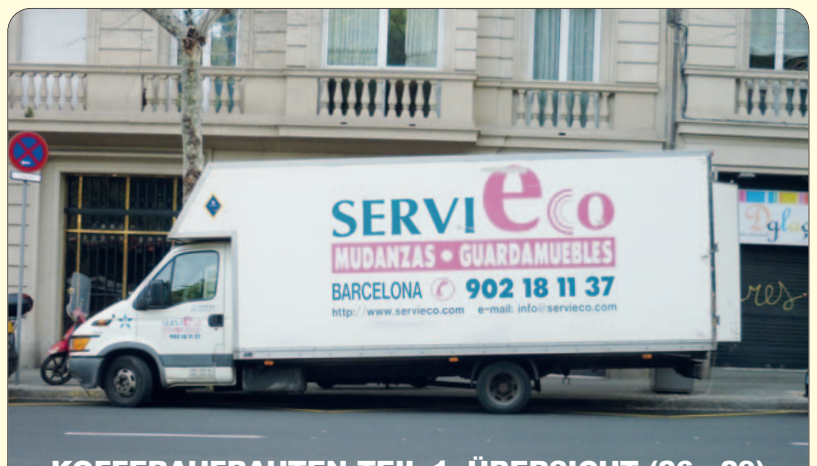
KOFFERAUFBAUTEN TEIL 1: ÜBERSICHT (26 - 29)