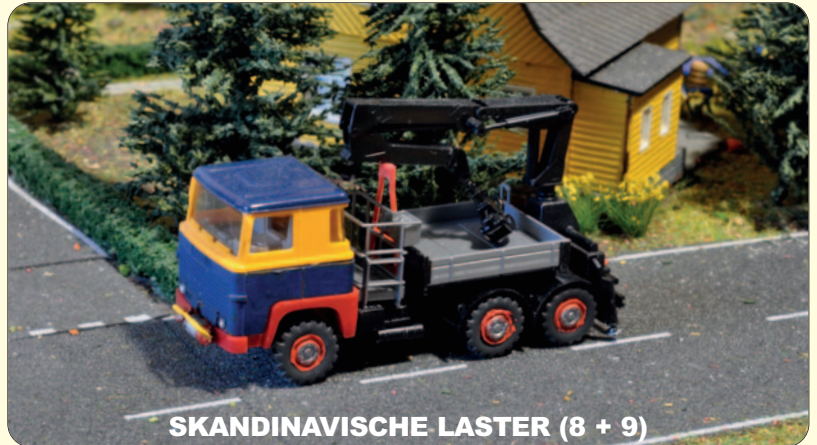
SKANDINAVISCHES LASTER (8 + 9)